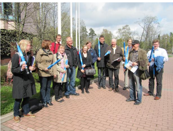
Tunnelmaa kevään exculta Kouvolasta

Vesihuoltojaoston työvaliokunta kokoontui kehittämispäivillä Rauman ja Porin suunnalla 23.-24.8. sekä Econet Oy:ssä 24.9. Kehittämispäivien yhteydessä tutustuttiin Vesi-Instituutti Wanderin toimintaan sekä KWH Pipe Oy:n Ulvilan PVC, PP ja PEX putkia valmistavaan tehtaaseen. Uutena teemana Vesihuoltojaostossa nostetaan esille vesihuollon organisaatioasiat. Tässä yhteydessä pohditaan myös kuntaliitosten vaikutuksia vesihuoltolaitosten toimintaan. Lausunnon antamista kansallisesta talousveden turvallisuussuunnitelmasta harkitaan. Vanhoista teemoista edelleen ajankohtainen on Vesihuoltoverkkojen suunnittelutehtävien määrittely ja ohjeistuksen laatiminen – projekti. Hanke on edennyt aikataulussa ja työn hedelmät esitellään syysseminaarissa.