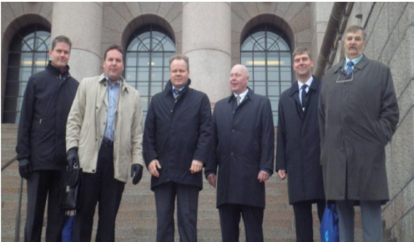
Työvaliokunnan eduskuntavierailun positiivisia tunnelmia.